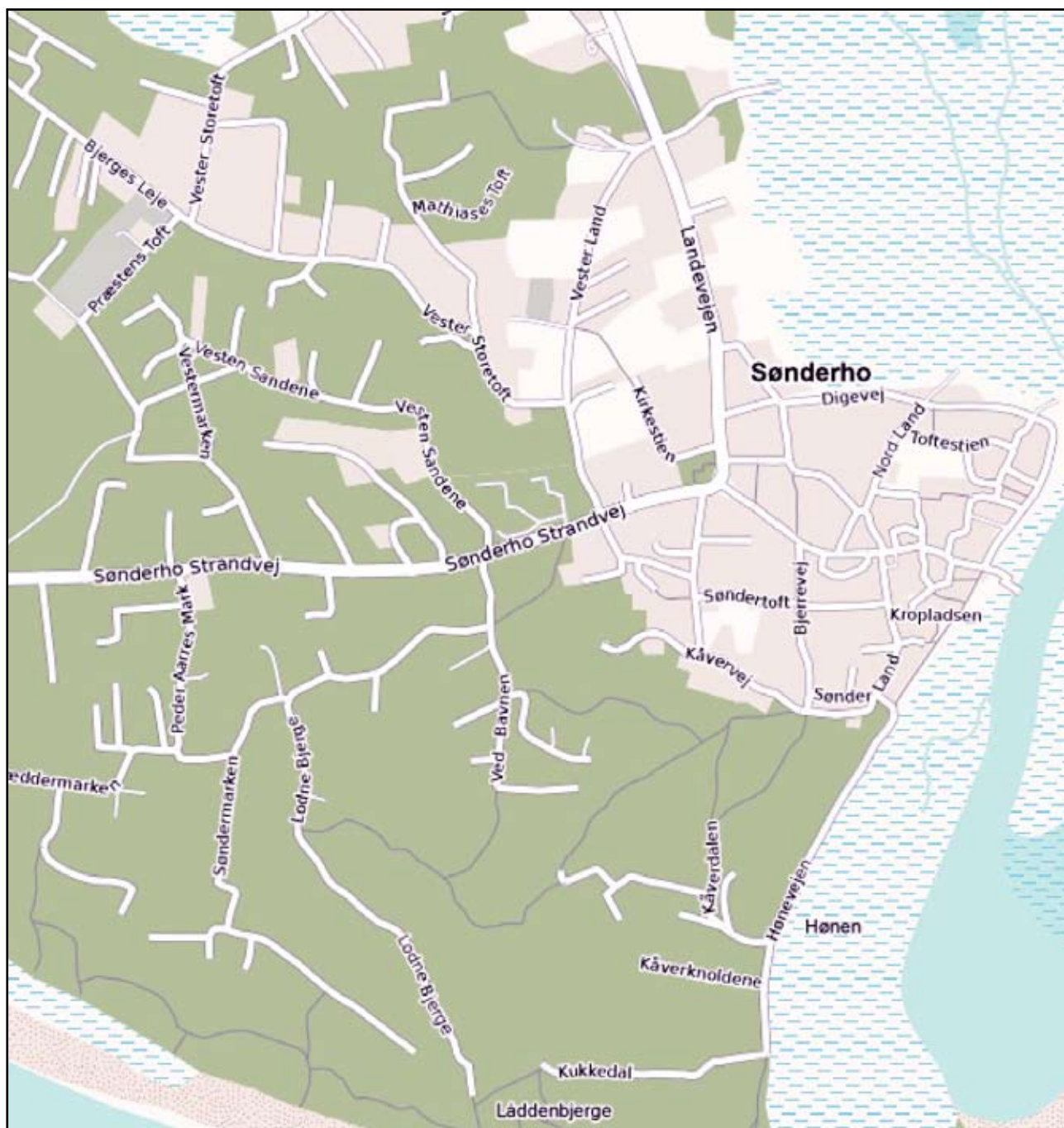
Kort over Sønderho, som viser placeringen af en del af de omtalte gader.