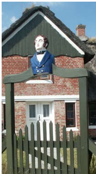
Galionsfigur over en havelåge i Sønderho. Den drev i land ved Fanø i 1851 og stammer fra sejlskibet Lord Palmerstone.

Skræddermarken: ingen yderligere kommentarer